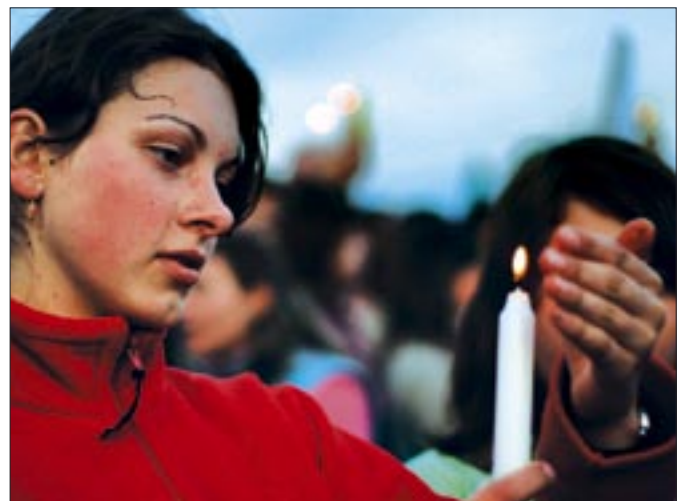
Świece – „ogień miłości” zapłonęły w sobotę na całym placu