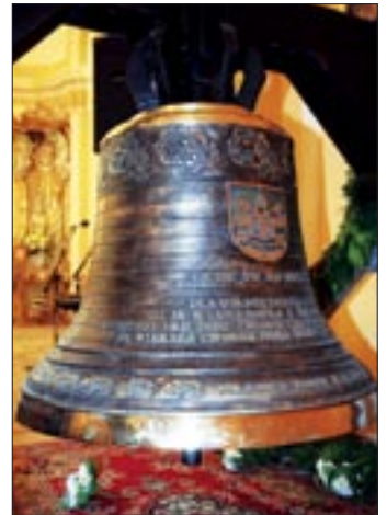
Największy z nowych dzwonów nosi imię św. Ignacy